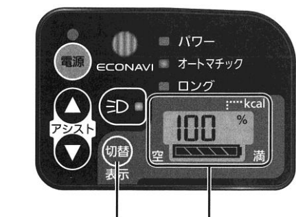
液晶表示切替ボタン 液晶表示部

電源が入った状態で、液晶表示切替ボタンを押すと、表示される情報が切り替わります。